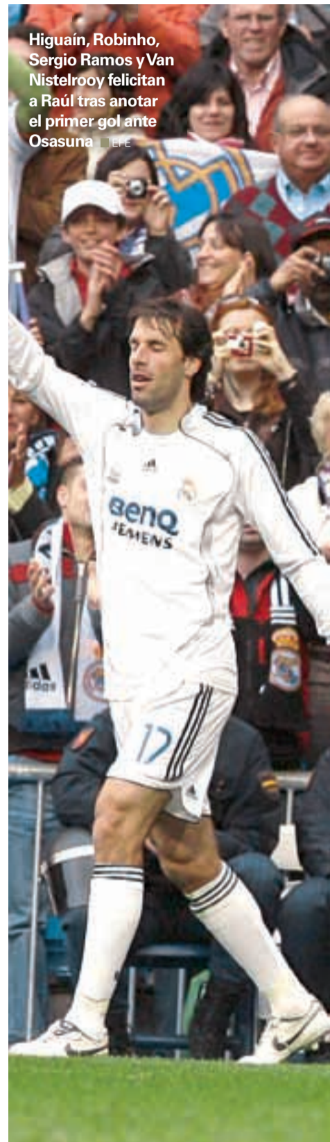
Higuain, Robinho, Sergio Ramos y Van Nistelrooy felicitan a Raúl tras anotar el primer gol ante Osasuna.

Mejores recuerdos en la hemeroteca del fin de semana deportivo dejan los triunfos de Fernando Alonso en Malasia, con una memorable salida o el enésimo título del Interviu, conquistando, por tercera vez consecutiva, la Copa Intercontinental. Unos éxitos que buscará emular el Real Madrid de baloncesto en la final de la Copa ULEB o los equipos españoles en las diferentes competiciones europeas durante una semana muy deportiva. Comienza lo bueno.