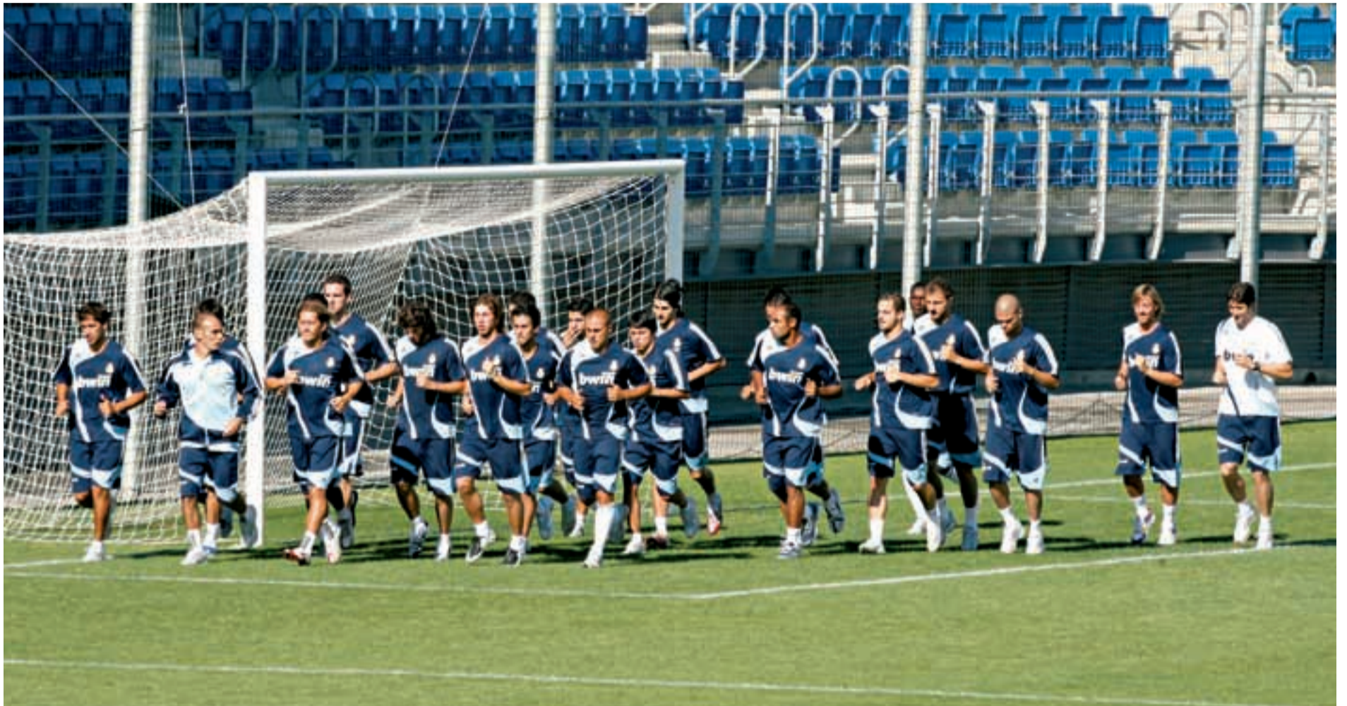
Valdebebas fue testigo de los dos primeros entrenamientos; Irdning toma el testigo