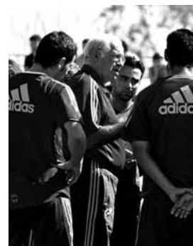
Aragonés hizo terapia de grupo

La primera aparición pública de los internacionales en tierras murcianas estuvo acompañada por unos 2.000 aficionados. El público asistió con curiosidad al entrenamiento y sólo les animó con unos tímidos aplausos en los primeros momentos, aunque la indiferencia fue la nota predominante durante la primera jornada de tra-