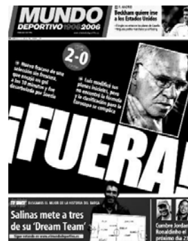
Portada de ‘Mundo Deportivo’