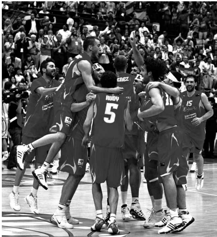
Los jugadores celebraron con entusiasmo el título nada más sonar la bocina final. No era para menos.

La segunda clave —quizá una de las más importantes en deportes de equipo— reside en el buen ambiente que ha rodeado al grupo desde que se concentraron en San Fernando (Cádiz). “Esta selección ha elevado la palabra equipo a su máxima expresión. Para mí somos una familia”, aseveraba Jorge Garbajosa. No eran palabras propiciadas por la euforia de la me-