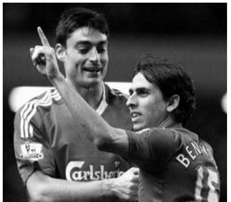
Riera, sancionado, y Benayoun, lesionado, no estarán en Anfield

Con este panorama de ausencias notables, Benítez podría inclinarse por adelantar a Fabio Aurelio e incluir a Dossena —éste como lateral izquierdo— como solución a la ausencia de Riera. Las otras alternativas serían incluir a Lucas Leiva en el centro del campo, acompañando a Xabi Alonso y Mascherano. O por el contrario, sacar su cara más ofensiva dando entrada al holandés Babel, aunque esto parece más improbable.